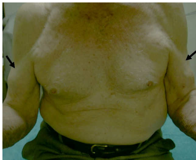
Fig. 1: Fotografía clínica de paciente octogenario en la que se observa ruptura antigua bilateral del tendón de la porción larga del bíceps braquial (flechas).

Los arcos de movilidad activos de hombro izquierdo limitados a 110 grados de flexión, 90 de abducción (prueba de Jove para supraespinoso normal), y 30 de rotación externa (prueba del infraespinoso +, el paciente se para con el brazo a los lados con el codo ipsilateral a 90 grados y el húmero medialmente girado a 45, se aplica una fuerza de rotación medial que el paciente resiste, el dolor o la incapacidad para resistir la rotación medial indican una prueba positiva para lesión del infraespinoso); con rotación interna normal; siendo